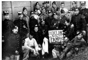
Foto van een groep militairen op Pampus

V: Wat voor personen staan er op de foto? (A: