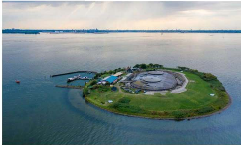
Een foto gemaakt met behulp van een drone van het fortiland Pampus.