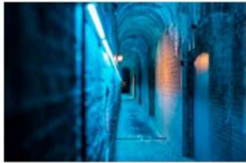
Een gang in het fort.