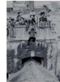
Jongeren op Pampus. In de anarchistische tijd vanaf de Tweede Wereldoorlog tot eind jaren tachtig heeft Pampus veel te lijden gehad. Ook dat is geschiedenis.

'Mogelijk kan de frituur niet aan op een dag waarop weinig energie wordt opgewekt.'