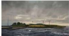
Impressie van de nieuwe entree van het fort.