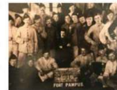
Nederlandse militairen ervoelden zich tijdens de mobilisatie in 1914 op het eiland.

De vernieuwingen op Pampus zullen voor de bezoeker niet weggemoffeld worden. 'Ik denk dat het juist een meerwaarde heeft ten link te leggen tussen het verleden en het heden. Dat je verket dat er vroeger een kolencentrale daalde om energie op te wekken, maar dat dat nu opene ander manier gebeurt. Op dit moment zijn er trouwers die kunstwerken te zien met als thema het klimaat en verduurzaming. Het is een samenwerking tussen Pampus en het Klimaatmuseum om onze verjaardag te vieren.' a